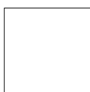
verniciato bianco RAL 9010 white RAL 9010 varnished