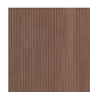
legno composito WPC WPC composite wood