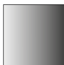
anodizzato naturale natural anodized