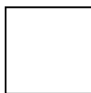
HPL bianco con anima nera white HPL with black core